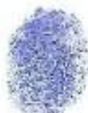
Huella dactilar (Índice derecho)