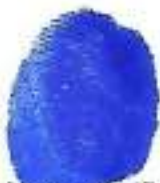
Huella dactilar (Índice derecho)