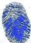
Huella dactilar (Índice derecho)